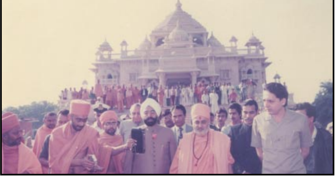
પૂર્વ રાષ્ટ્રપતિ ઝેલસિંહ અને શ્રી પ્રમુખસ્વામી સાથે.

માત્ર નેતાઓ જ નહીં, પરંતુ દંભી સાધુ બાવાઓ, વ્યભિચારી બાપુઓ, લોકોને છેતરતા