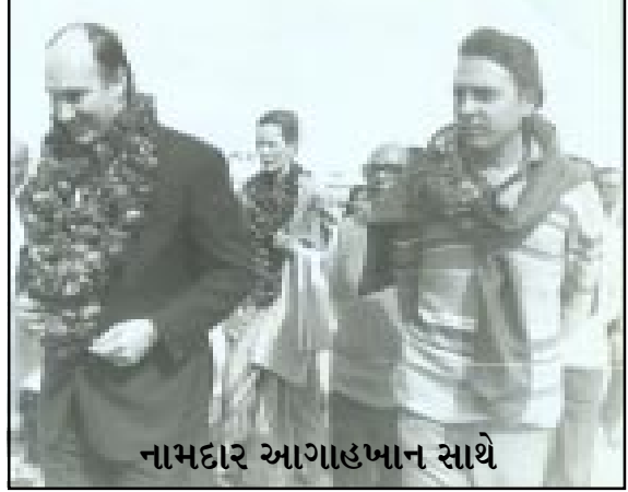
નામદાર આગાહખાન સાથે

એમાંયે રઝિયા નામની એક મુસ્લિમ કન્યાનો કિસ્સો નોંધનીય છે. રઝિયા વડોદરાની એક કોન્વેન્ટ સ્કૂલમાં ભણતી હતી. એક મોટર મિકેનિક